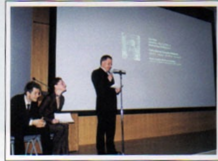
Power Talk ( Explicación pública de trabajos en Aichi Arts Center.)

La naturaleza utiliza espinas para defenderse a sí misma, y los humanos sólo las cortamos y cubrimos la realidad, tratando de curar el momento sangriento que la naturaleza sufre. ¿Qué necesitamos esperar?