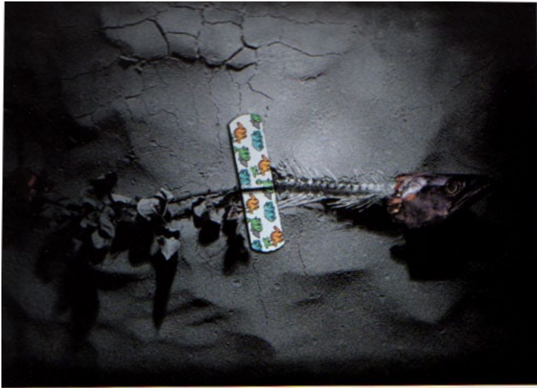
Cartel de la serie: Déjenos vivir... Premio de Plata (segundo lugar) en categoría: Visual Design

«Fragilidad es una delgada línea entre dos polos.»