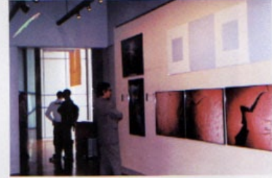
Exposición de trabajos ganadores: NAGOYA DESIGN DOI 2002.

Mayor información en: http://www.idcn.jp/compe2002