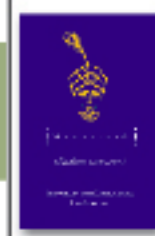
Diseños de Iván Krizan.

En el próximo número veremos un caso de éxito dentro la industria papelería analizando su organización y funcionamiento de su identidad corporativa.